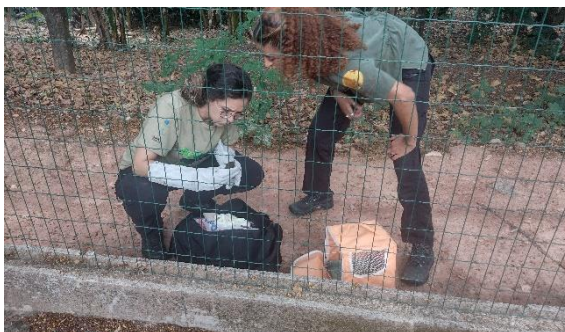
Resgate e avaliação médica Data:28/09/2023