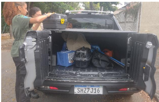
Equipamentos e materiais Autoria: Carolina Rodrigues Bordignon Data:28/09/2023