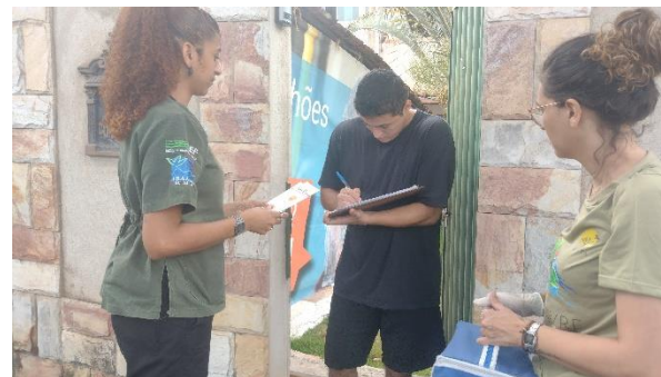
Preenchimento de ficha e entrega de panfleto Autoria: Carolina Rodrigues Bordignon Data:28/09/2023