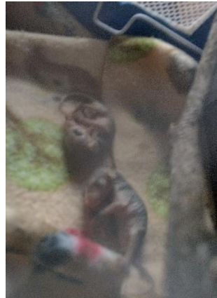
Filhotes de gambá-de-orelha-branca recolhidos Data:28/09/2023