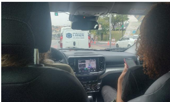
Deslocamento e atendimento remoto Autoria: Carolina Rodrigues Bordignon Data:28/09/2023

O segundo chamado atendido foi referente ao resgate de dois filhotes de gambá-de-orelha-branca. Segundo o relato do morador, os animais caíram de uma árvore em frente sua residência. Então os indivíduos foram recolhidos, acondicionados em caixas de transporte e ficaram sob observação da equipe. O terceiro chamado aconteceu no bairro Estoril. Um morador solicitou à equipe do SOS o resgate de um filhote de beija-flor que não conseguia voar. Em todos os casos acompanhados os animais foram resgatados pela equipe, acondicionados em caixa de transporte para ser posteriormente encaminhado ao Centro de Triagem de Animais Silvestres do IBAMA em Belo Horizonte, Minas Gerais (CETAS/BH), parceiro do projeto e onde ficam sob cuidados veterinários especializados.