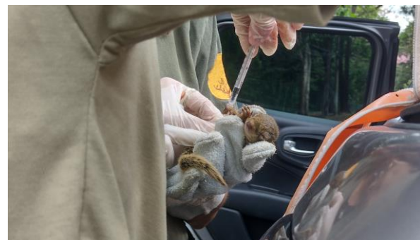
Atendimento veterinário no local Data:28/09/2023